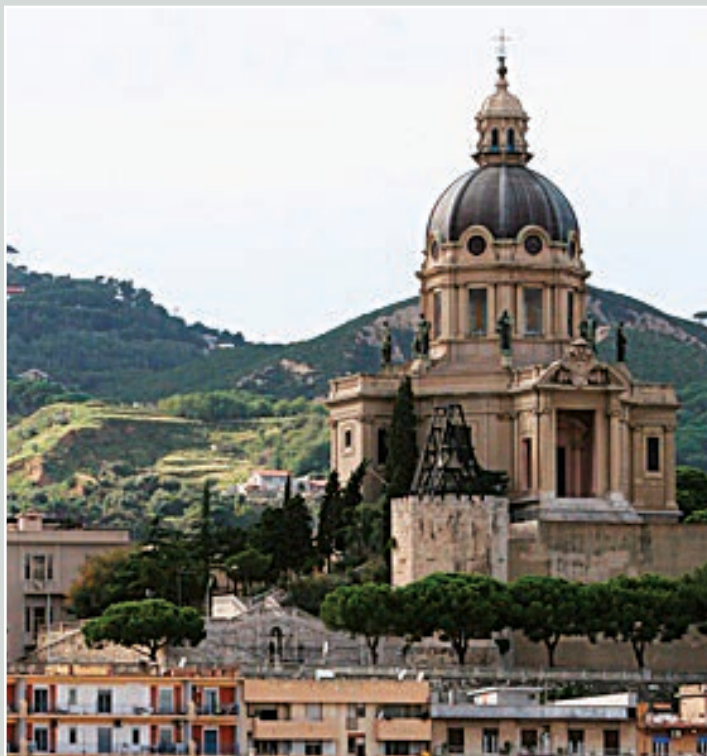
A LATO: SACRARIO DEL CRISTO RE